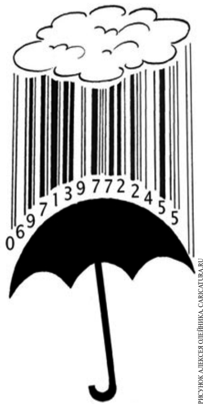
РИСУНОК АЛЕКСЕЯ ОШЕИНИКА, САРКАТУРА.RU