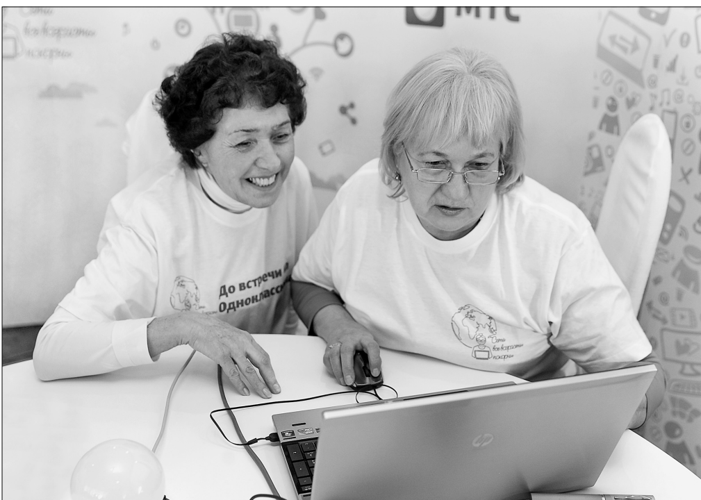
Студентки выполняют практические задания на скорость