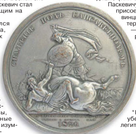
МЕДАЛЬ «СРАЖЕНИЕ ПОД ЕЛИСАВЕТПОЛЕМ. 1826 г.»