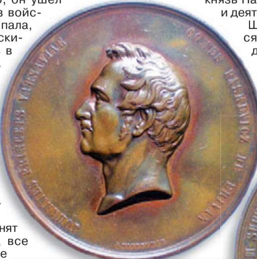
МЕДАЛЬ, ПОСВЯЩЕННАЯ И. Ф. ПАСКЕВИЧУ. 1850 г. (АВЕРС И РЕВЕРС)